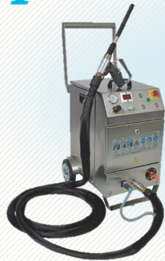
ドライアイス洗浄機 GT-120E