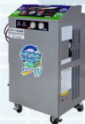
YN-1234PROW <エアコンマスターPRO>