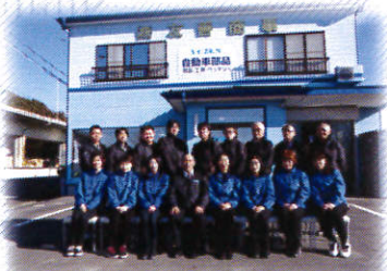
本社 & メカサポ