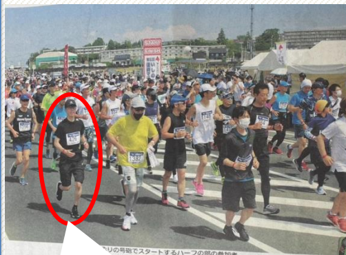
昨年(2022年)の新聞記事に当社社員が写ってました！

第7回いしのまき復興マラソンが6月11日(日)に開催されます！昨年は当社社員3名がハーフマラソンに参加し、完走できた社員もいれば時間切れで完走できなかった社員もいました。今年も参加しますのでぜひ応援お願いいたします！