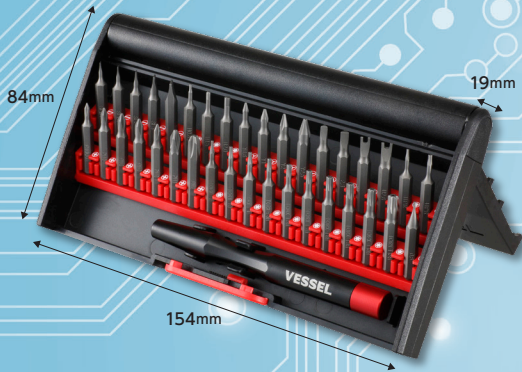
スタンド式ケース